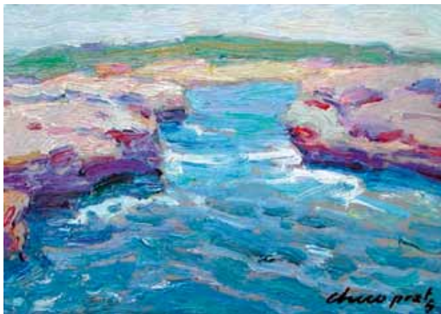
Título Marina Técnica Óleo/tela Dimensiones 15 cm. x 21 cm.