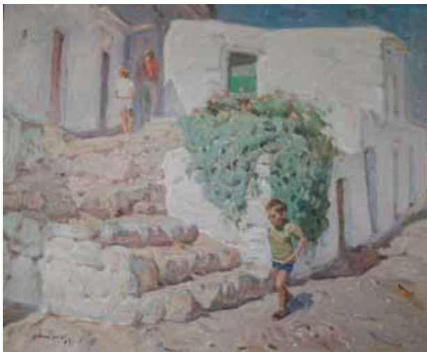
Títol Nins al carrer Técnica Óleo/tela Dimensiones 65 cm. x 54 cm.