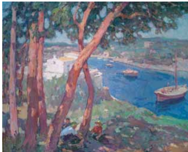
Título Marina Técnica Óleo/tela Dimensiones 81 cm. x 100 cm.