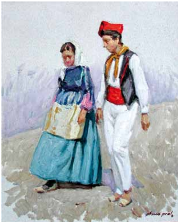
Título Parella de pagesos Técnica Óleo/tela Dimensiones 46 cm. x 38 cm.