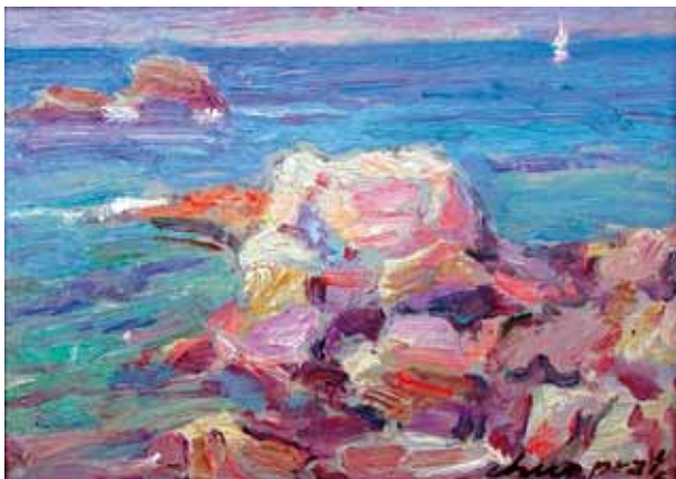
Título Marina Técnica Óleo/tela Dimensiones 15 cm. x 21 cm.