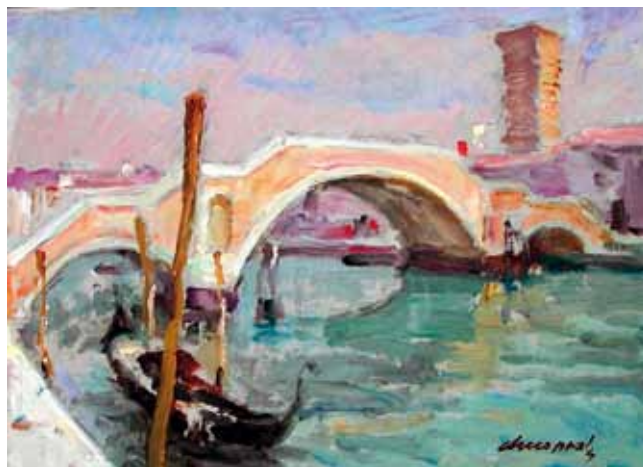
Título Pont a Venècia Técnica Óleo/tela Dimensiones 34 cm. x 33 cm.