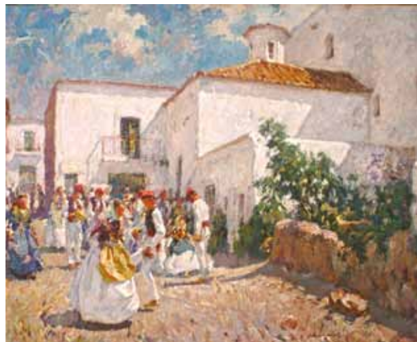
Título Festa popular Técnica Óleo/tela Dimensiones 81 cm. x 100 cm.