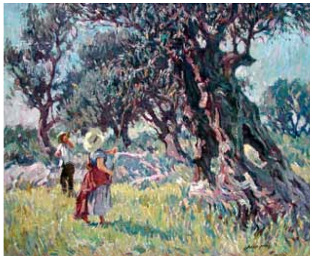
Oliveres d'Eivissa Títol Óleo/tela Técnica 73 cm. x 60 cm. Dimensiones