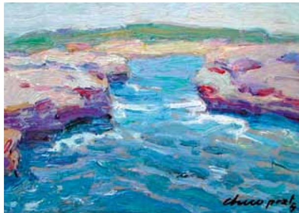
Título Marina Técnica Óleo/tela Dimensiones 15 cm. x 21 cm.