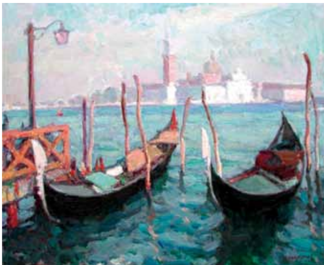
Título Góndoles Técnica Óleo/tela Dimensiones 50 cm. x 61 cm.