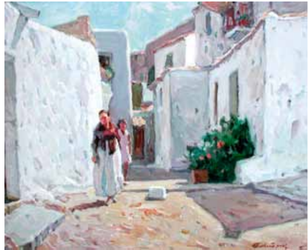
Títol Carrers d'Eivissa Técnica Óleo/tela Dimensiones 60 cm. x 73 cm.