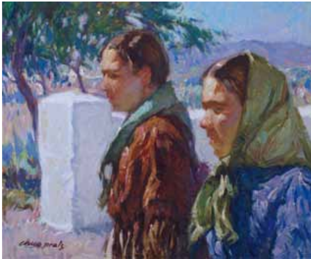
Títol Parella de pagesos al camp Técnica Óleo/tela Dimensiones 61 cm. x 50 cm.