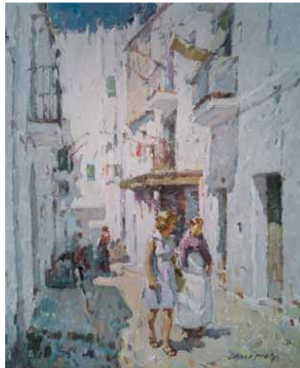
Títol Carrer d'Eivissa Tècnica Óleo/tela Dimensiones 65 cm. x 54 cm.