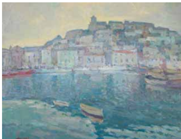
Port d'Eivissa Título Óleo/tela Técnica 73 cm. x 92 cm. Dimensiones