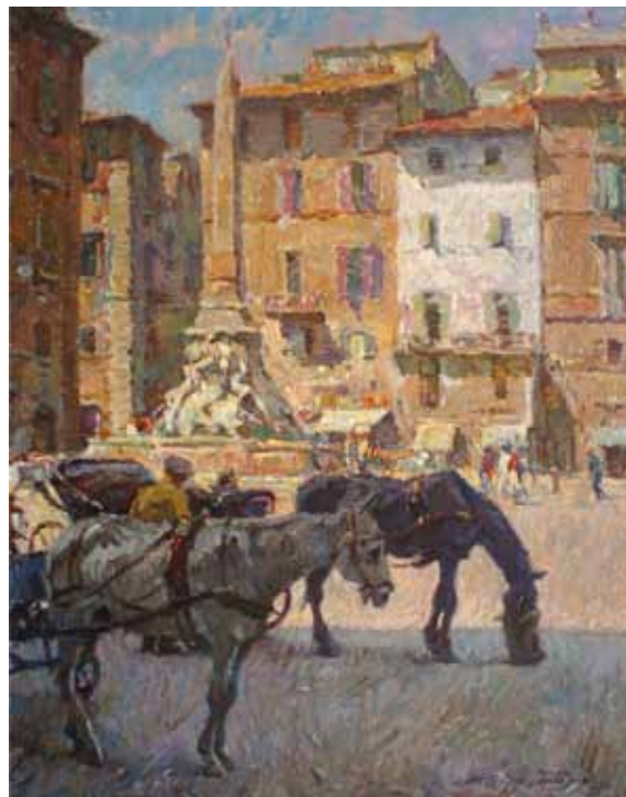
Título Roma Técnica Óleo/tela Dimensiones 81 cm. x 65 cm.