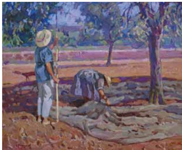
Recollint ametlles Título Óleo/tela Técnica 73 cm. x 60 cm. Dimensiones