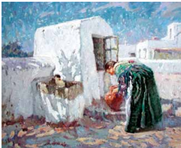
Títol Trajnant aigua Tècnica Óleo/tela Dimensiones 54 cm. x 65 cm.