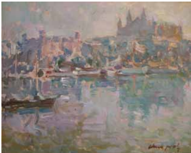
Título Port de Palma Técnica Óleo/tela Dimensiones 33 cm. x 41 cm.