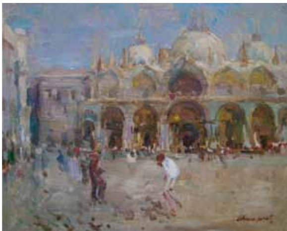
Título Venècia Técnica Óleo/tela Dimensiones 33 cm. x 41 cm.