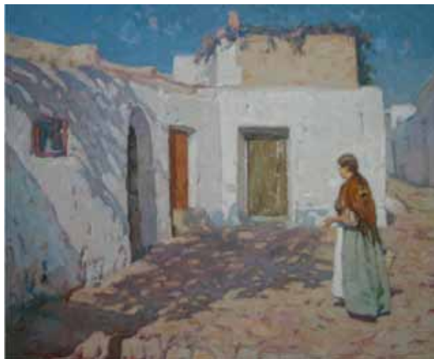
Cases a Eivissa Títol Óleo/tela Técnica 60 cm. x 73 cm. Dimensiones