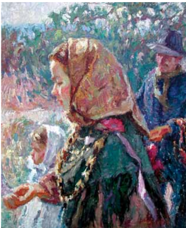
Título Eivissencs de festa Técnica Óleo/tela Dimensiones 65 cm. x 54 cm.