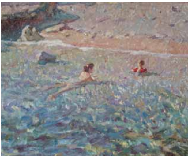
Título Dona nedant Técnica Óleo/tela Dimensiones 62 cm. x 50 cm.