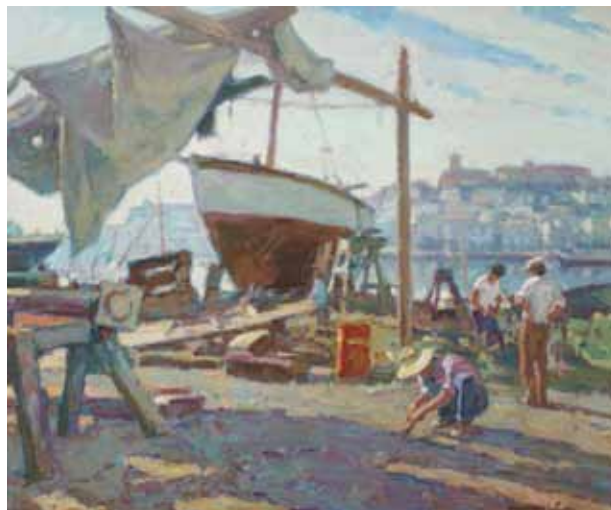
Título Drassanes Port d'Eivissa Técnica Óleo/tela Dimensiones 60 cm. x 73 cm.