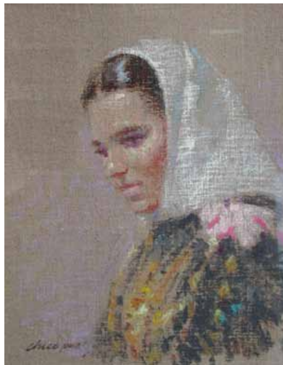
Título Pagesa Técnica Óleo/tela Dimensiones 41 cm. x 33 cm.