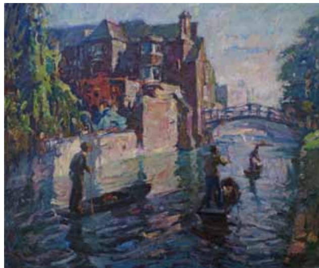
Título Oxford Técnica Óleo/tela Dimensiones 65 cm. x 65 cm.