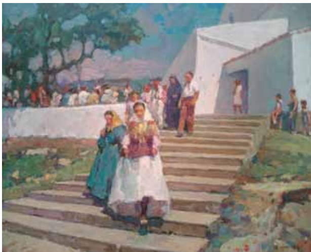
Título Sortint de l'església Técnica Óleo/tela Dimensiones 60 cm. x 73 cm.