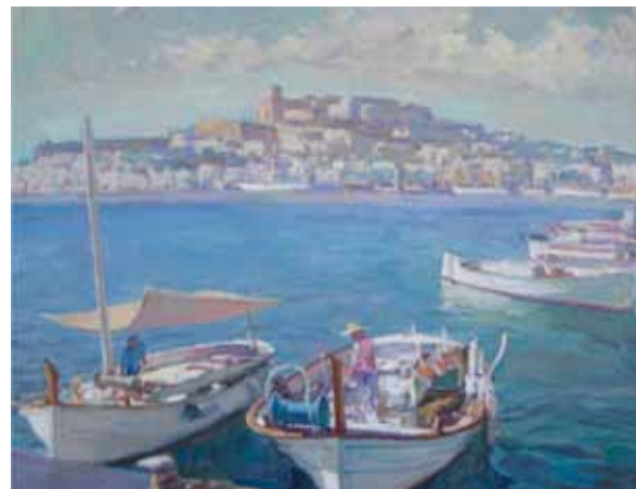
Título Port d'Eivissa Técnica Óleo/tela Dimensiones 73 cm. x 97 cm.