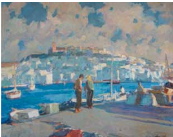
Título Port d'Eivissa Técnica Óleo/tela Dimensiones 73 cm. x 92 cm.