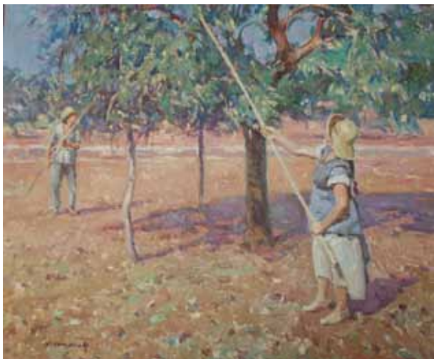
Títol Dones espolsant ametlles Técnica Óleo/tela Dimensiones 65 cm. x 54 cm.