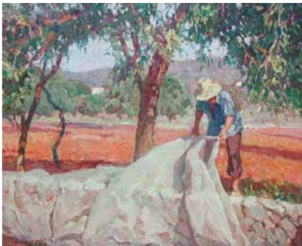
Título Recollint ametlles Técnica Óleo/tela Dimensiones 73 cm. x 60 cm.