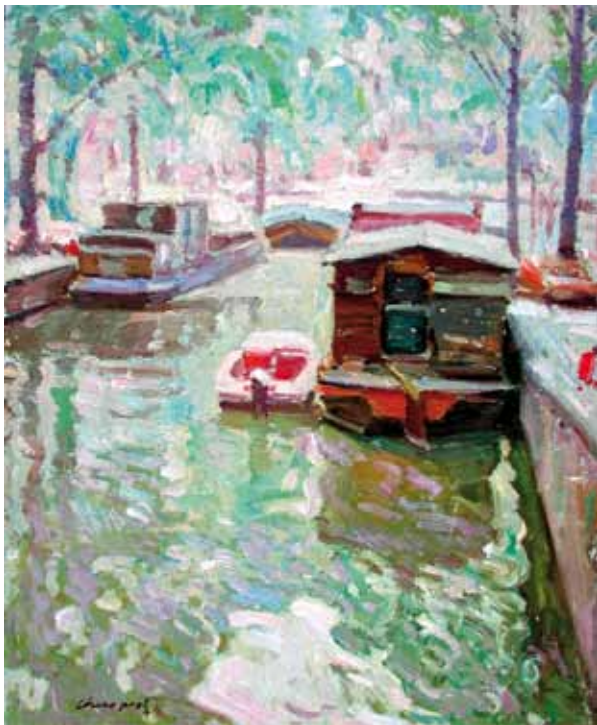
Título Àssterdam Técnica Óleo/tela Dimensiones 61 cm. x 50 cm.